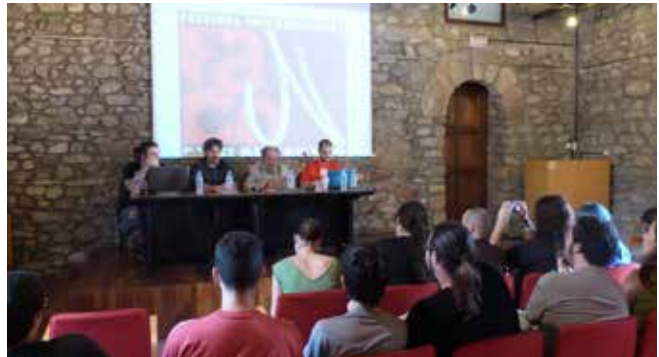
Presentació del Festival FanCon BCN

És previst que Fancon utilitzi diferents equipaments i espais del municipi com el Parc de l'Hostal del Fum, el Pavelló Municipal d'Esports Maria Víctor, l'Institut Ramon Casas i Carbó, el Teatre de la Vila i els propis carrers de la vila.