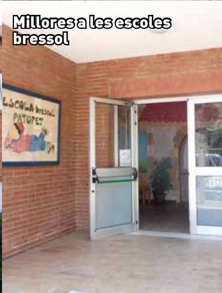
Millores a les escoles bressol