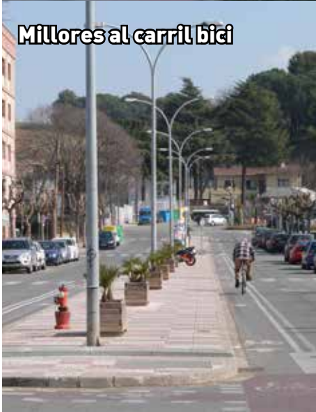
Millores al carril bici