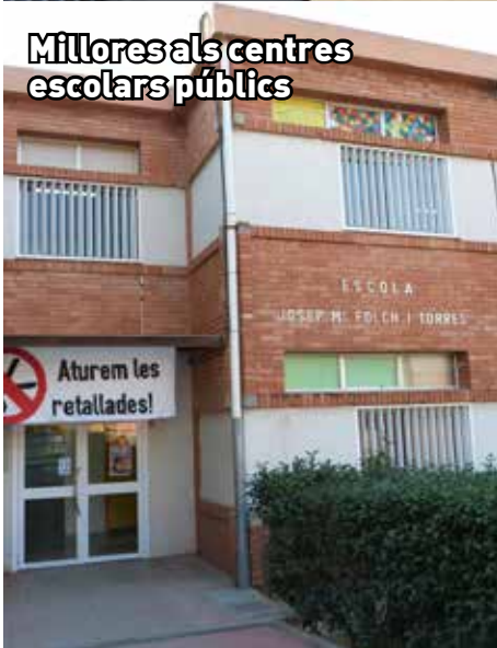
Millores als centres escolars públics