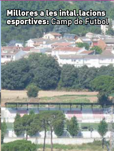
Millores a les instal·lacions esportives: Camp de Futbol