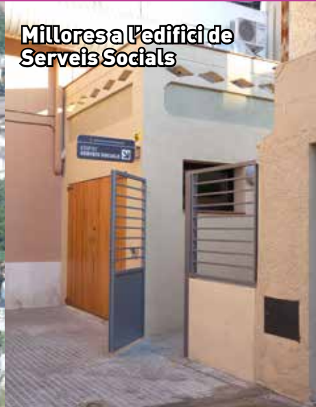
Millores a l'edifici de Serveis Socials