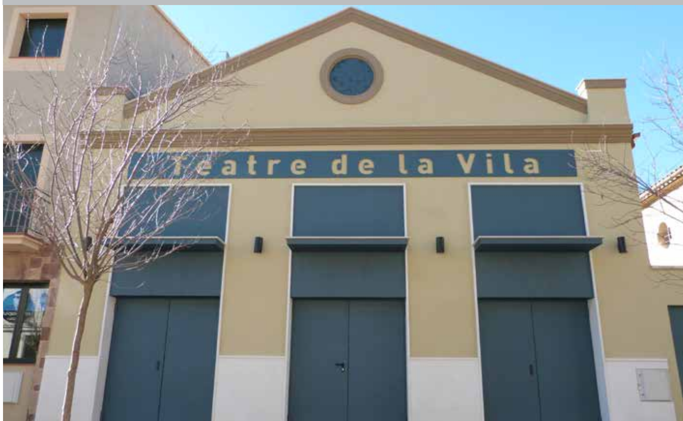
Rehabilitació del Teatre de la Vila i reformes a la Sala Polivalent