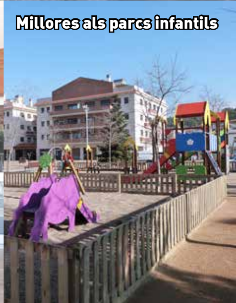
Millores als parcs infantils