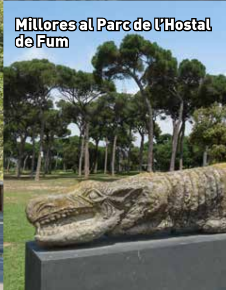
Millores al Parc de l'Hostal de Fum