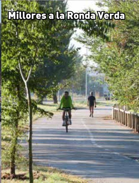
Millores a la Ronda Verda